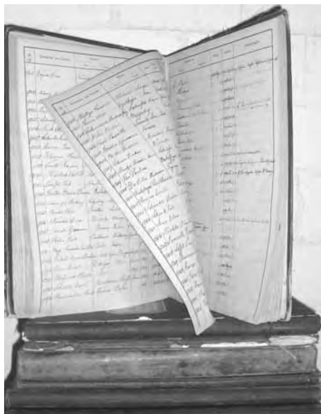
Einwohnerregister anno 1890

Die Schweiz ist bekannt für ihre Schokolade, schneebedeckte Berge, grüne Wiesen, wohlbehütete Geheimnisse, teure Uhren, den weltbesten Tennisspieler und... viele, sehr viele Statistiken. Über praktisch alles wird hierzulande eine Statistik geführt. Nun, verstehen Sie mich nicht falsch. Es liegt mir fern, dies zu kritisieren. Denn Statistiken gehören bei den Einwohnerdiensten zum Alltag. Ein kleines Beispiel gefällig? In Bischofszell leben genau in diesem Moment 5552 Einwohner, 2777 Männer, 2775 Frauen. 4380 sind Schweizer, 1172 ausländische Staatsangehörige, wovon die meisten aus Portugal stammen. 2297 Personen sind ledig, 2515 verheiratet, 335 verwitwet, 405 geschieden – da glänzen die Augen aller Statistikfans.