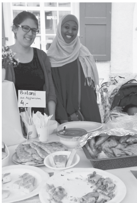
Solinetz Bischofszell engagiert am MarktgassMarkt 2016

Bischofszell verbindet – an einem langen gedeckten Tisch begegnen sich Menschen aus der Schweiz und vielen anderen Kulturen, um zusammen zu essen, zu feiern, zu tanzen und zu lachen. Das Fest der Kulturen findet am Samstag, 26. August in der Marktgasse und auf dem Grubplatz statt.