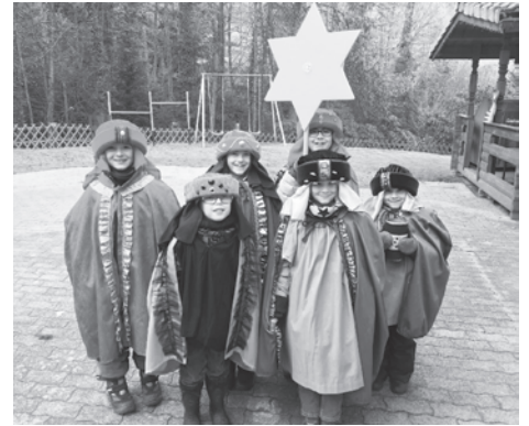
Sternsinger in Halden