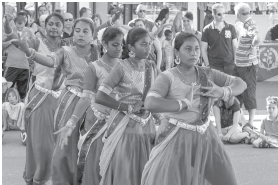
Tanzgruppe beim Kulturfest 2015 in Weinfeldern