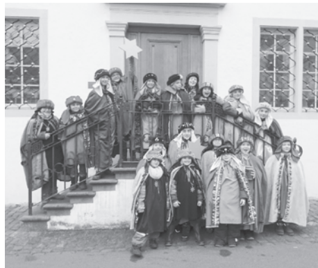
Sternsinger aus Schweizersholz und Kenzenau